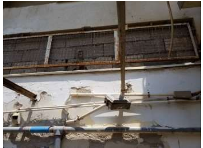
חלון עליון לסתימה