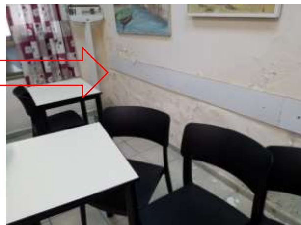
קיר משותף עם חדר מכונות