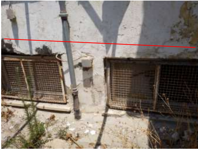
חלונות תחתיים או לסתימה או ליצירת גגון עליון ראה פרט מצורף