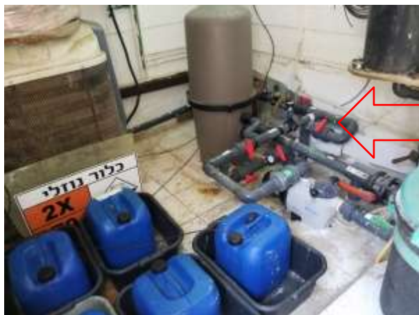
חדר מכונות- מעביר מים לקיר החדר